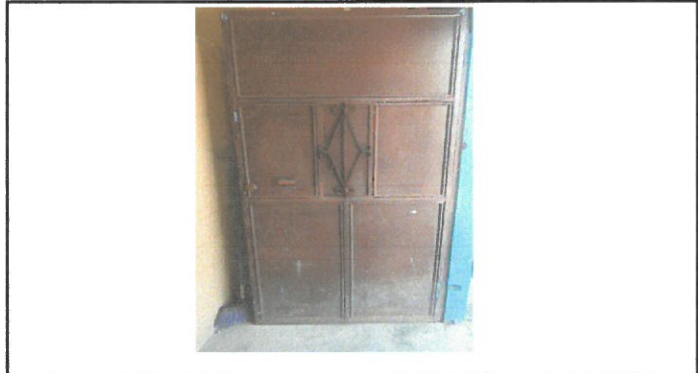
Vista de puerta para mantenimiento.