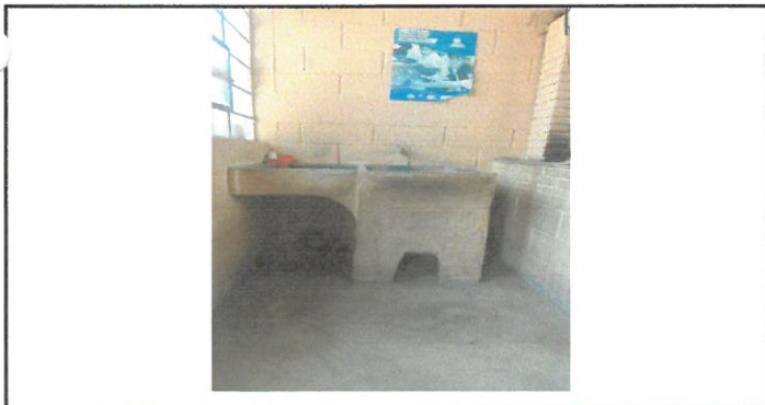
Vista de area de cocina a remozar.