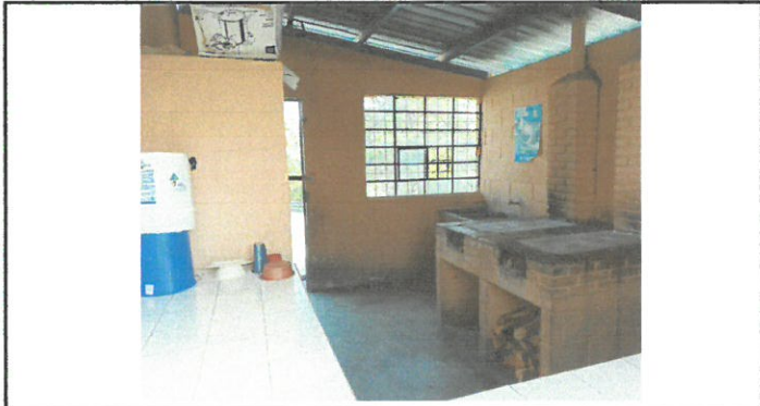
Vista de desayunador a remozar