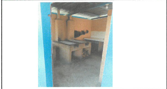
Vista de piso de cemento a sustituir