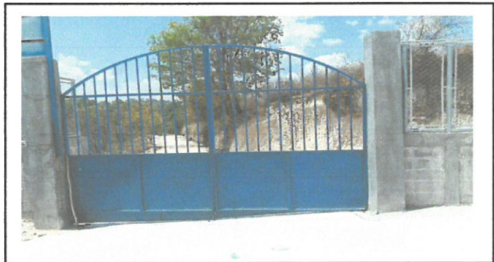
Mantenimiento de porton del establecimiento.

Observación: Si es necesario se pueden agregar fotos adicionales y actualizar el número de hojas.