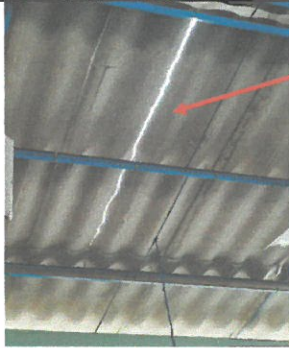
Foto1: Vista de área a remozar (Módulo 1)