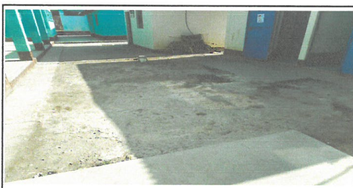
PAVIMENTO EN ESTA AREA

Observación: Si es necesario se pueden agregar hojas adicionales y actualizar el documento de fotos.