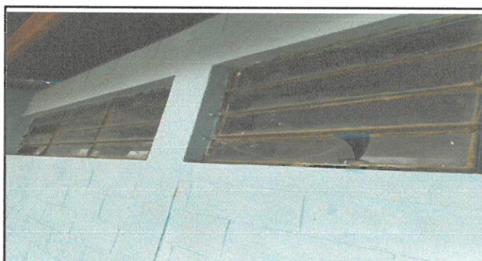
VENTANAS FRONTALES DE UN AULA