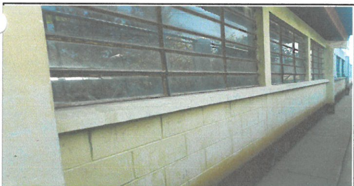
VENTANAS EN LA PARTE DE ATRÁS DE LA MISMA AULA Y PINTURA EN LAS PAREDES INTERIOR Y EXTERIOR