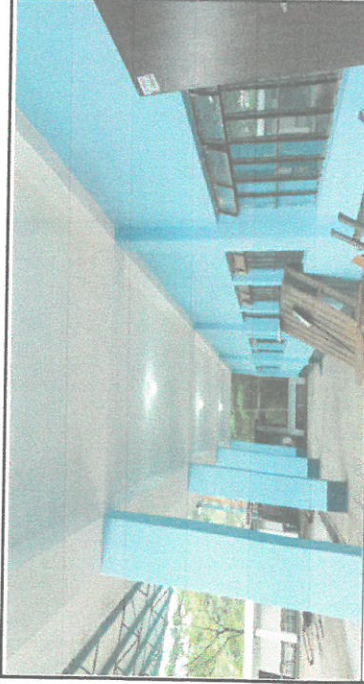
Vista donde se sustituyo el sistema electrico