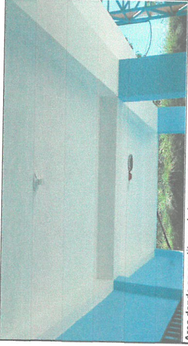
Area donde se sustituyo el sistema electrico

Observación: Si es necesario se pueden agregar hojas adicionales y adjuntar el número de hojas.