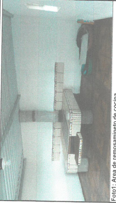
Foto1: Área de remosamineto de cocina