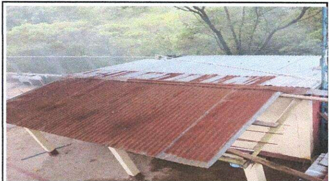
Foto 2: vista del area donde se necesita el cambio de techo de cocina