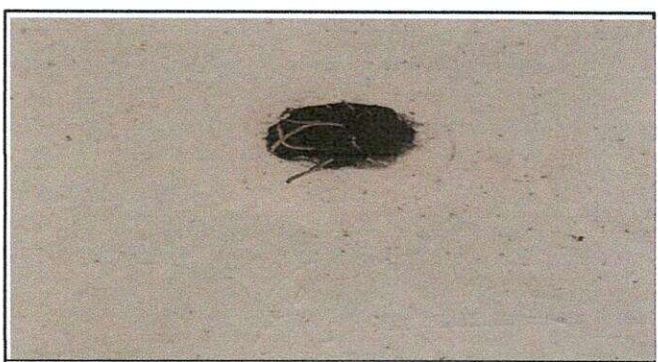
Area donde se sustituye el sistema electrico

Observación: Si es necesario se pueden agregar hojas adicionales y actualizar el número de hojas.