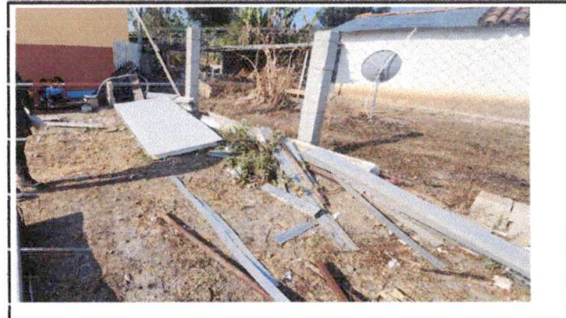
Foto 2: muro perimetral existente, se colocaran hiladas de block, tubo y malla.