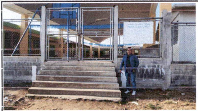
Foto1: Evaluador de campo en el establecimiento.