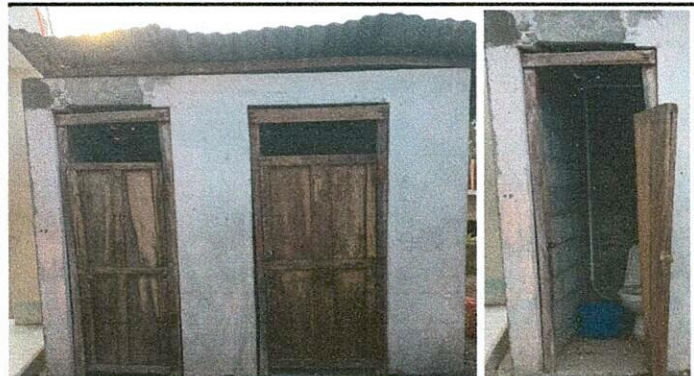
Foto1: Mejoramiento de servicios sanitarios