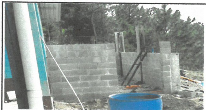
Foto 4: Proceso de la construcción de 4 sanitarios y un mingitorio.