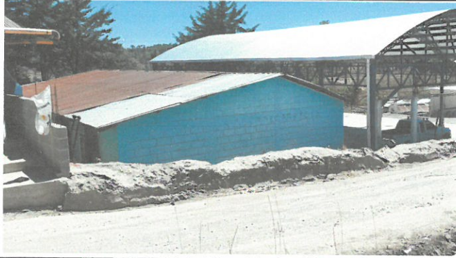
Foto1: Condiciones de la escuela antes del remozamiento