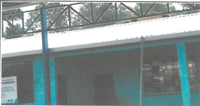
Foto1: Pintura de paredes antes del remozamiento.