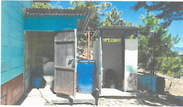
Foto1: Servicios sanitarios internos anteriormente.