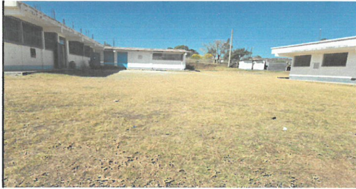
Vista de área con necesidad de pavimentar el patio