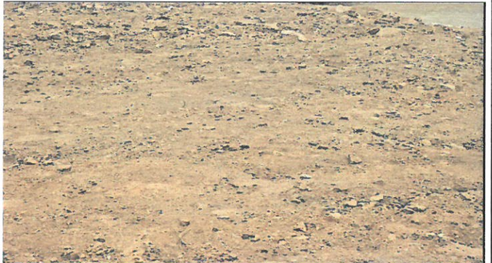
Vista de área pavimentar ya esta en proceso de trabajo