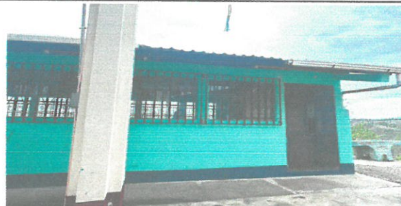
Foto 6: remodelación de techo, ya que la anterior se encontraba con goteras y muy dañadas.

Observación: Si es necesario se pueden agregar hojas adicionales y señalar el número de hojas.