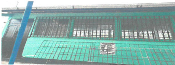
Foto 5: Cambio de ventanas y colocación de balcones, ya que las ventanas se encontraban en mal estado.