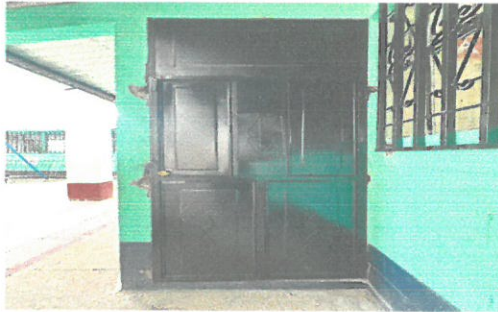
Foto 1: REMODELACIÓN DE PUERTA DE DIRECCIÓN, YA QUE LA ANTERIOS YA ESTABA EN MAL ESTADO