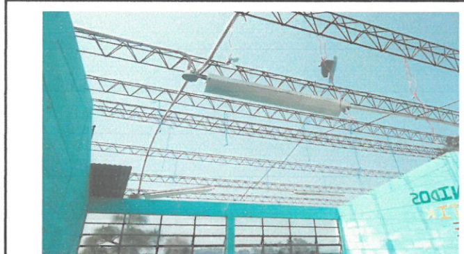
Foto 4: CAMBIO DE VENTANAS, YA QUE LOS ANTERIORES ESTABÁN DAÑADOS