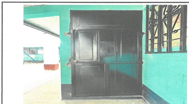
Foto 6: Cambio de puerta, de la dirección ya que la anterior se encontraba con goteras y muy dañadas.

Observación: Si es necesario se pueden agregar hojas adicionales y actualizar el número de hojas.