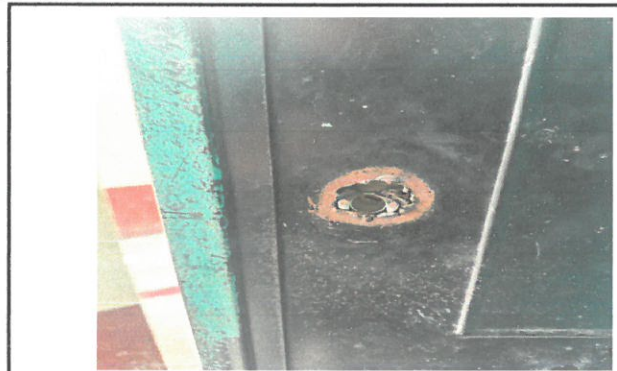
Foto 2: REMODELACIÓN DE PUERTA DE DIRECCIÓN, YA QUE ESTA, ESTÁ EN MAL ESTADO