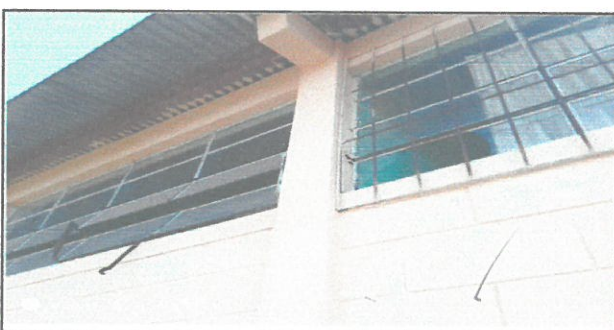
Vista exterior de las aulas con cambio de balcon

Observación: Si es necesario se pueden agregar hojas adicionales y actualizar el número de hojas.