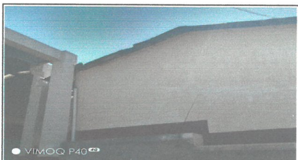
Vista exterior de las aulas de techo