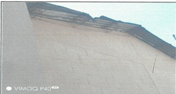
Vista interior de las aulas cambio de techo