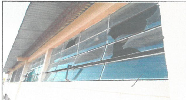
Vista de los vidrios a cambiar