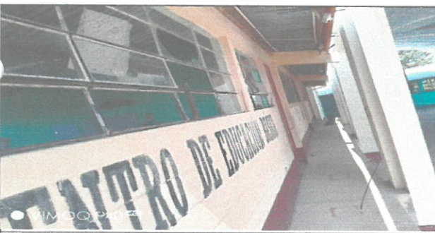
Vista interior de las aulas con cambio de balcon