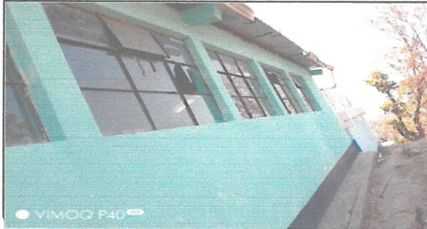
Vista de los vidrios a rezozar