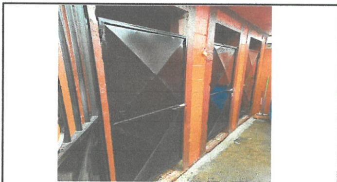
REMOZAMIENTO DE BAÑO SANITARIO