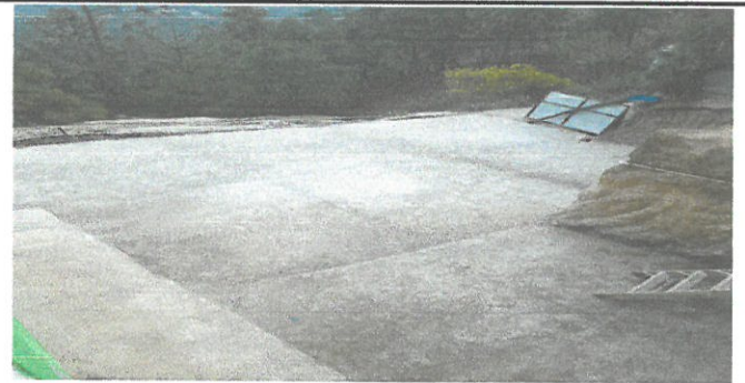
PAVIMENTO DE PATIO