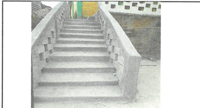
REMOZAMIENTO DE GRADAS