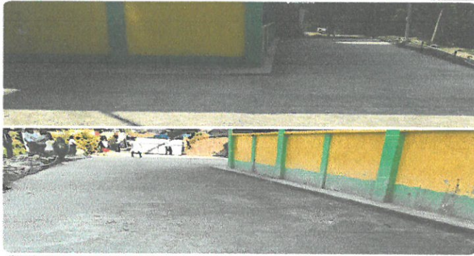
PAVIMENTO DE PERIMETRO