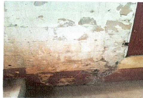
Foto 6: Situación en que se encuentra la pared de un aula actualmente.

Observación: Si es necesario se pueden agregar hojas adicionales y actualizar el número de hojas.