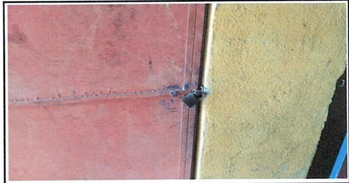
Sustitución de candados de los servicios sanitarios

Observación: Si es necesario se pueden agregar hojas adicionales y actualizar el número de hojas.