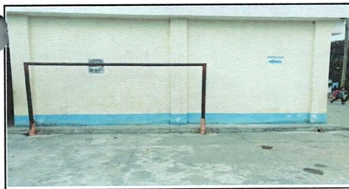
Vista de Pintura de aulas a ser sustituidas