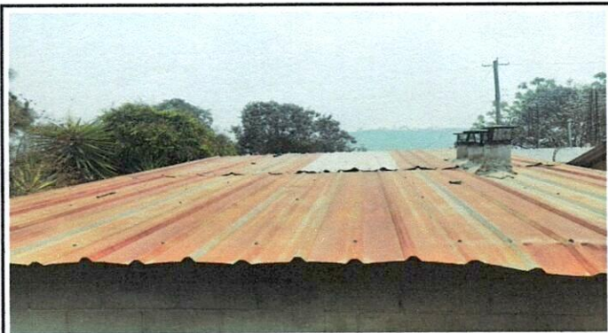
Vista de cubierto de techo de cocina a sustituir