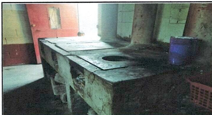
Vista de Planchas a ser remodelados