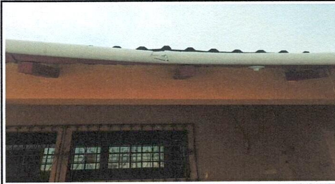
Vista de Canales de agua a sustituir