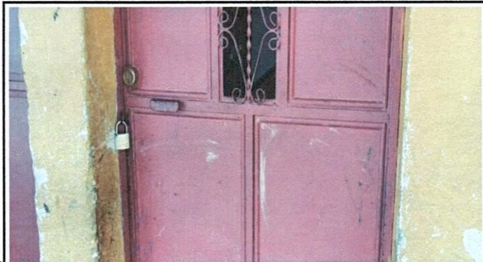
Vista de chafas a sustituir