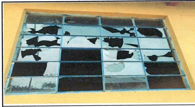
Vidrios de Ventanas a sustituir

Observación: Si es necesario se pueden agregar hojas adicionales y actualizar el número de hojas.