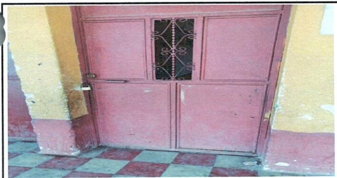
Vista de puertas a sustituir