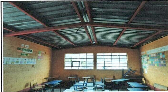
Instalacion de Electricidad de dos aulas