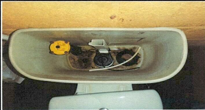
Vista de accesorios a sustituir