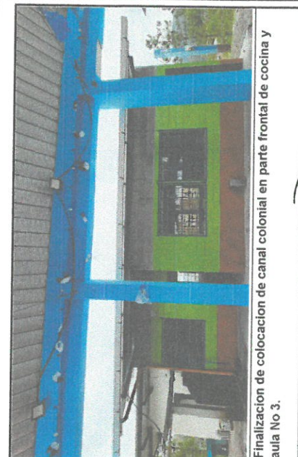
Finalización de colocación de canal colonial en parte frontal de cocina y aula No 3.

Observación: Si es necesario se pueden agregar hojas adicionales para especificar el tipo de hojas.