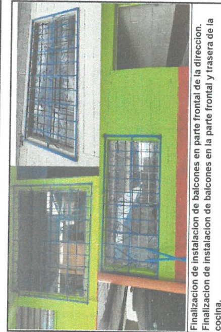
Finalización de instalación de balcones en parte frontal de la dirección. Finalización de instalación de balcones en la parte frontal y trasera de la cocina.