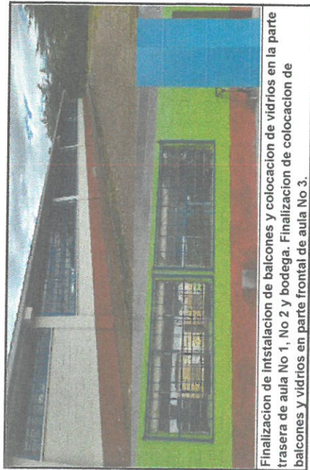
Finalización de instalación de balcones y colocación de vidrios en la parte trasera de aula No 1, No 2 y bodega. Finalización de colocación de balcones y vidrios en parte frontal de aula No 3.