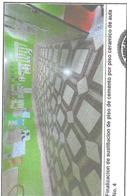
Finalización de sustitución de piso de cemento por piso cerámico de aula No. 4