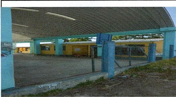
sustitucion de maya perimetral, por muro de block, angulo exterior