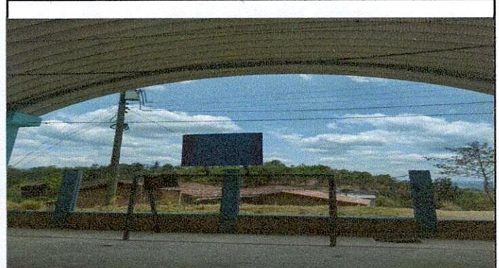
sustitucion de maya perimetral, por muro de block, angulo interior