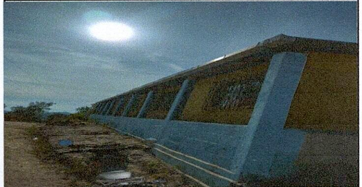
sustitucion de maya perimetral, por baranda de metal, angulo exterior