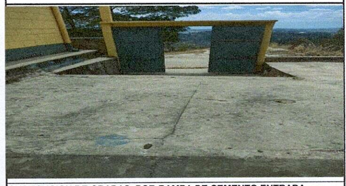
SUSTITUCION DE GRADAS, POR RAMPA DE CEMENTO ENTRADA PRINCIPAL, PARTE INTERIOR

Observación: Si es necesario se pueden agregar hojas adicionales y actualizar el número de hojas.