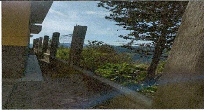
sustitucion de maya perimetral, por baranda de metal, angulo interior