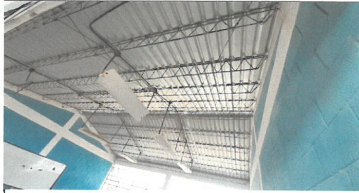
Foto1: Techo instalado Módulo I (renglón 1)