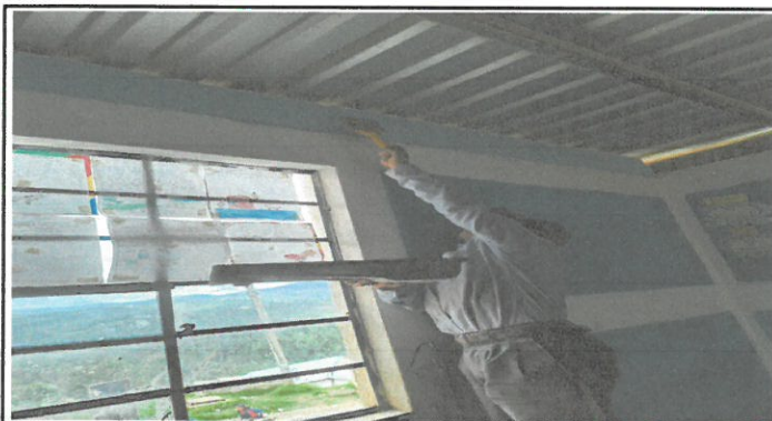
Foto 3: Colocación de hilera de block y pintura en 2 aulas (renglón 3)