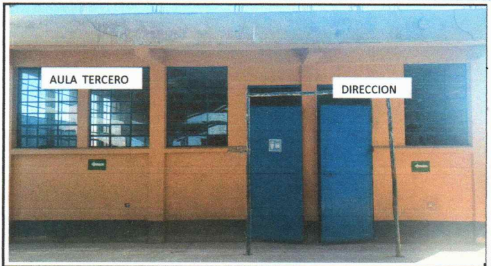
Vista del aula de tercero primaria y dirección, para la instalación de valcones.