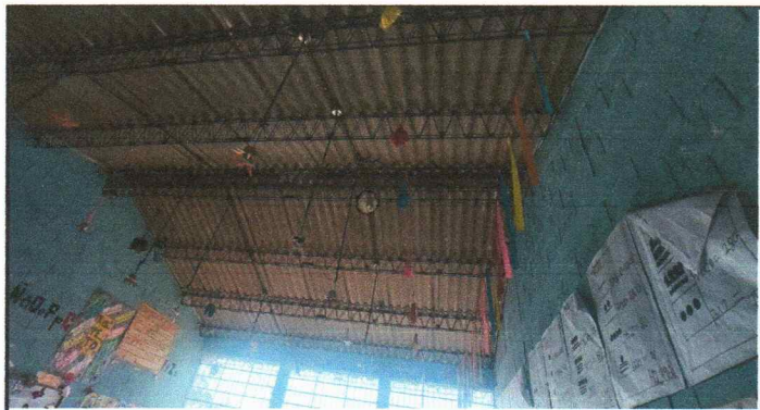
Vista interior, de las aulas para el cambio de techo de durtalita a lámina troquelada calibre 26