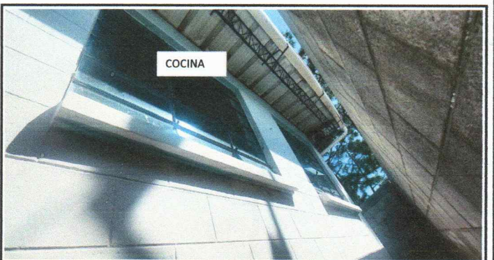
Vista de los ventales de la parte posterior de la cocina donde se instalarán valcones.

Observación: Si es necesario se pueden agregar hojas adicionales y actualizar el número de hojas.