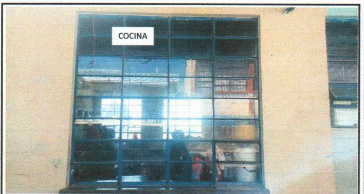
Vista de los ventanales de la cocina donde se instalarán valcones