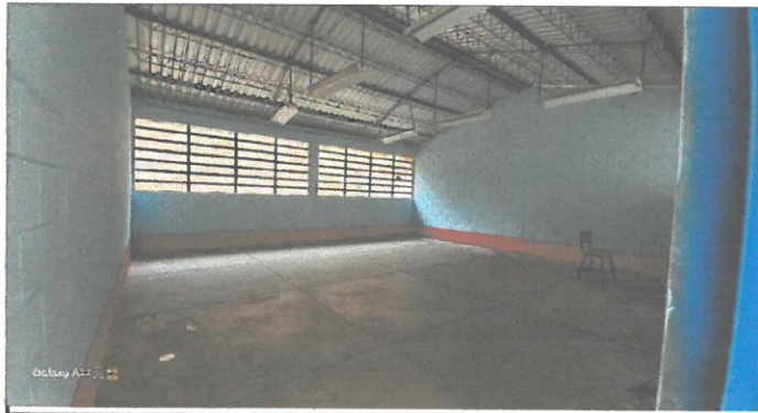
Foto 3: CULMINACION DEL PINTADO DE LAS AULAS POR LOS PADRES DE FAMILIA