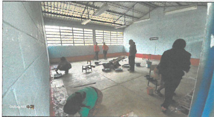
Foto 1: REALIZACION DEL PINTADA DE AULAS, POR LOS PADRES DE FAMILIA FECHA 11 DE ABRIL