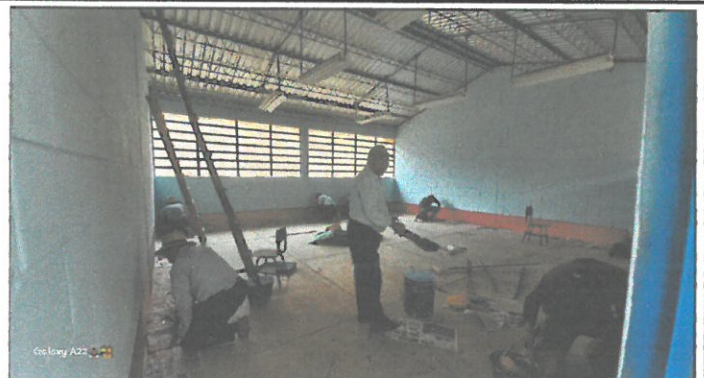
Foto 2: REALIZACION DEL PINTADA DE AULAS, POR LOS PADRES DE FAMILIA 12 DE ABRIL