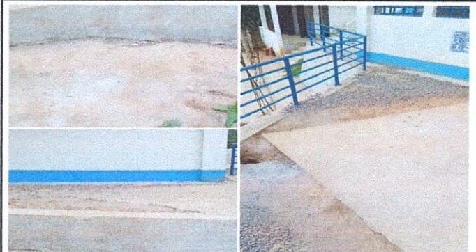
Reparación de loza y gradas.