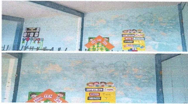
Reparación de pared por humedad