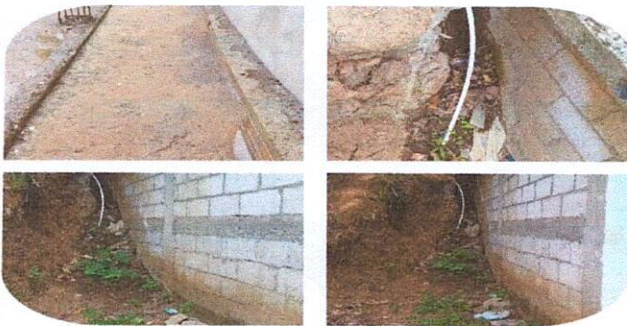
Reparación de pared exterior