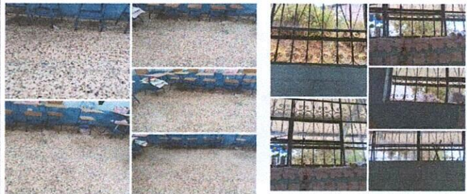
Reparación de Piso dañado por piso de granitos, cambio de vidrios de ventanas.

Observación: Si es necesario se pueden agregar hojas adicionales, actualizando el número de hojas.