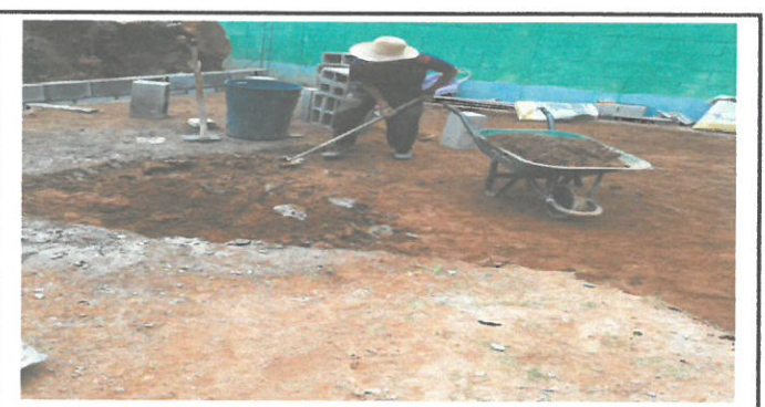
Foto 6: instalación de plancha de concreto en el patio de la escuela

Observación: Si es necesario se pueden agregar hojas adicionales y actualizar el número de hojas.