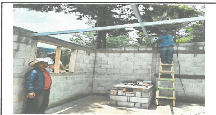
Foto 5: instalación de soporte metálico para laminas en la cocina