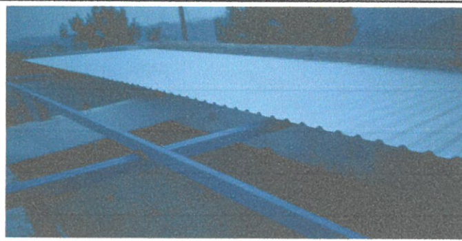
Cambio de lamina acanalada por lamina troquelada