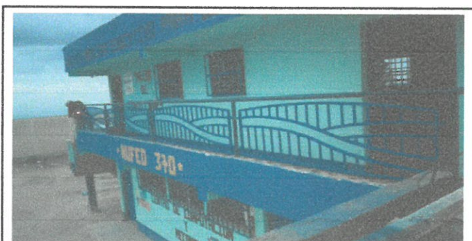
Colocacion de baranda pasa mano de estructura metalica

Observación: Si es necesario se pueden agregar hojas adicionales y actualizar el número de hojas.