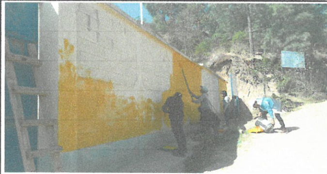
Paintando pared de circulacion externa