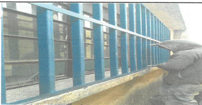
Colocacion de baranda de proteccion de estructura metalica