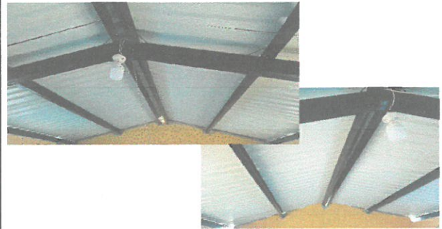
Foto del aula ya terminada con nuevas láminas y estructuras de metal