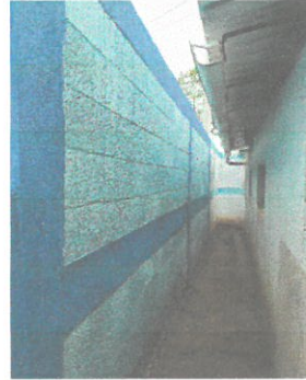
Foto del muro perimetral ya construido y pintado por fuera y por dentro