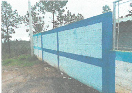
Foto del muro perimetral ya construido y pintado por fuera y por dentro