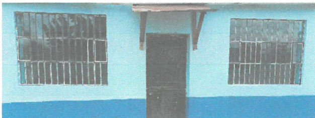
Foto de las dos nuevas ventanas terminadas y fachada pintada de la cocina