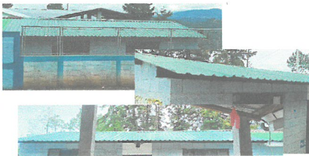
Foto del aula ya terminada con nuevas láminas y estructuras de metal