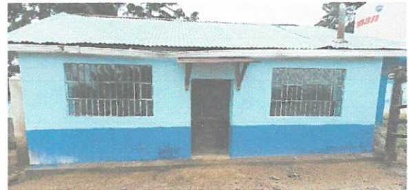
Foto de las dos nuevas ventanas terminadas y fachada pintada de la cocina

Observación: Si es necesario se pueden agregar hojas adicionales y actualizar el número de hojas.