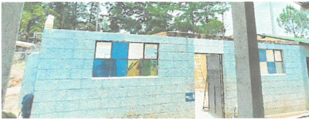
Foto del proceso de desmantelamiento del cambio del techo y estructura de un aula