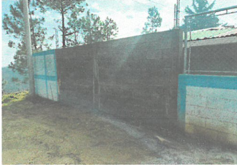
Foto del muro perimetral en proceso de construcción, con 3 metros de alto y 5 de largo con su columnas y soleras.