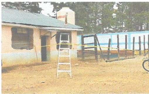
Foto de abertura y construcción de bastidor de las ventas de la cocina