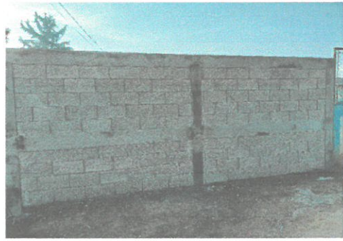
Foto del muro perimetral en proceso de construcción, con 3 metros de alto y 5 de largo con su columnas y soleras.