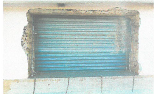
Foto de abertura y construcción de bastidor de las ventas de la cocina

Observación: Si es necesario se pueden agregar hojas adicionales y actualizar el número de hojas.