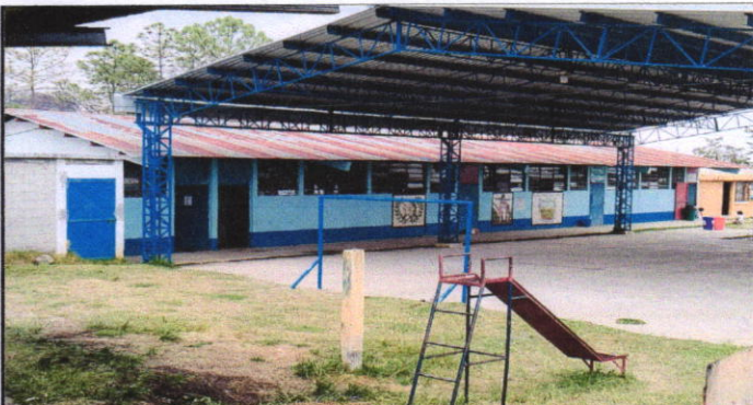
Foto 3: Vista de la parte de enfrente del módulo , se remozará con la instalación de un canal galvanizado de 30 metros con 4 bajadas.