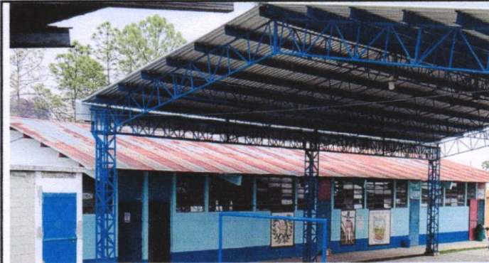
Foto 1: Vista de la cubierta del techo, este módulo de tres aulas y baños de niñas y niños se remozará con cambio de láminas.