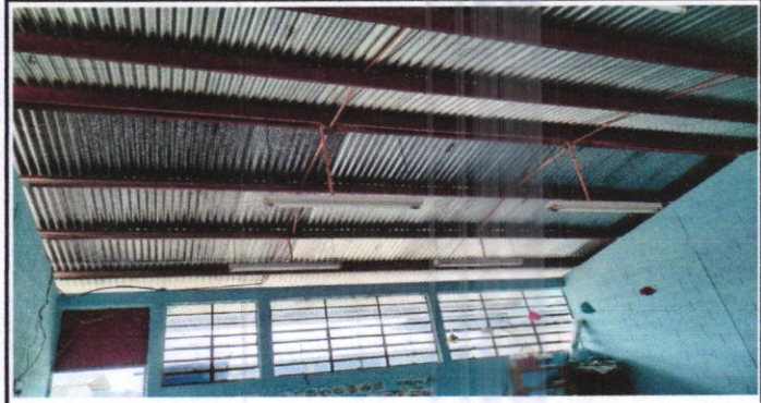
Foto 2: vista de la cubierta de la estructura del techo de un módulo de tres aulas y 2 baños , se remozará con pintura de todas las costaneras.