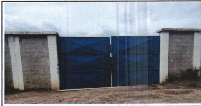
Foto 6: vista del portón, Se remozará con el cambio de color de la pintura del portón de entrada.

Observación: Si es necesario se pueden agregar hojas adicionales y actualizar el número de hojas.