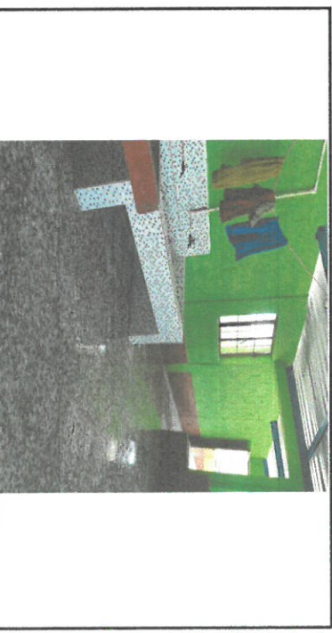
Foto 4: Vista del espacio que se remozó de la cocina, unificación de paredes, cambio de puerta, colocación de dos ventanas, una adelante y una atrás, se construyó una mesa de concreto y lavamanos con azulejo, sustitución de piso de concreto por granito