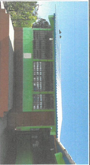
Foto1: Vista de la cubierta del techo de un aula, se remozó la cubierta de techo con lamina troquelada y pintada de costaneras