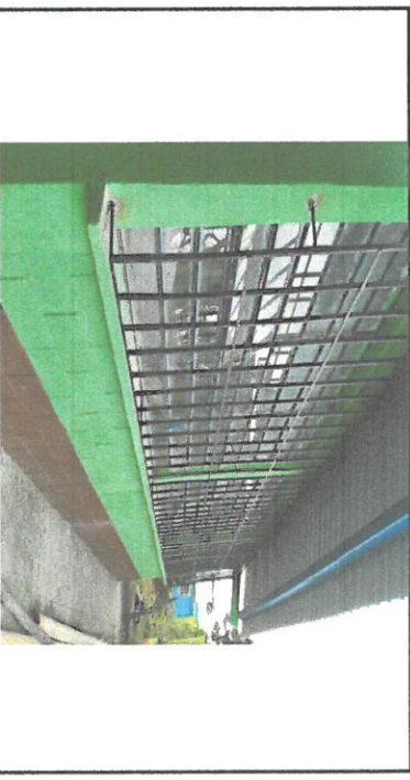
Foto 2: Vista del aula donde se observa el área donde se instaló balcones en el espacio de adelante y atrás, se cambio chapa de la puerta del aula