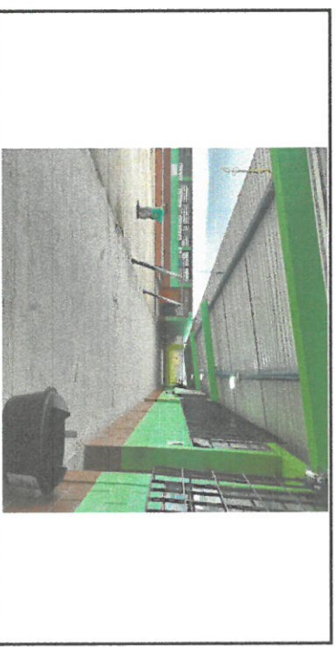
Foto 6: Instalación eléctrica en el área de remozamiento, se sustituyó cables y se instaló lámparas, apagadores y plafoneras

Observación: Si es necesario se pueden agregar hojas adicionales y actualizar el número de hojas.