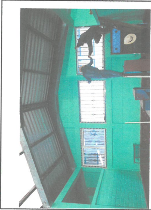
Foto1: Sustitución de marcos de madera por marcos de PVC. Sustitución de vidrios lisos por vidrios reflectivos.