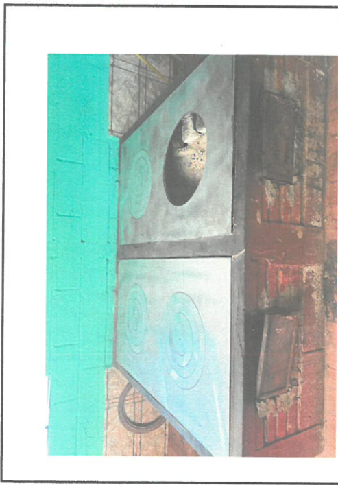
Foto 5: Sustitucion de planchas de metal por planchas de metal nuevas y pintada de paredes

Observación: Si es necesario se pueden agregar hojas adicionales y actualizar el número de hojas.