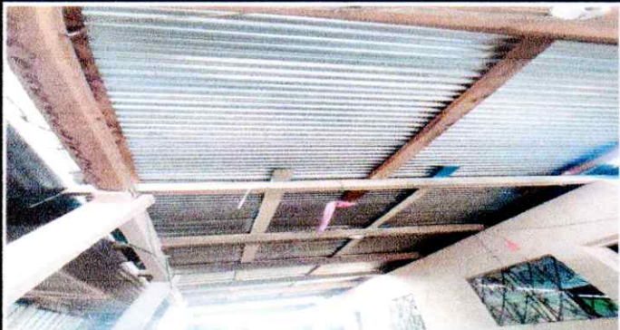
Foto 3: En esta imagen se visualiza el techo del patio en mal estado y mala presentación.