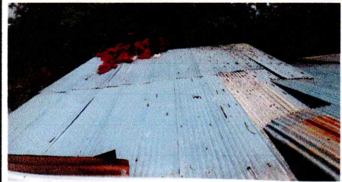
Foto 1: En esta fotografía se visualiza el techo de las aulas en mal estado (rotas, oxidadas, añadidas, etc.) Por eso se decidió cambiar.