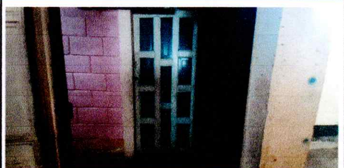
Foto 6: Así mismo se visualiza la fotografía de la puerta de la dirección en mal estado, por eso se realizará el cambio para mayor seguridad de administración.

Observación: Si es necesario se pueden agregar hojas adicionales y actualizar el número de hojas.