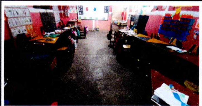
Foto 4: Se visualiza la fotografía del piso de las aulas también en mal estado e incómodo para los alumnos cuando se moja, por eso se realizará el cambio.