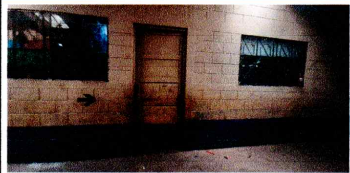
Foto 5: De la misma manera se observa la fotografía de las puertas de las aulas en mal estado, por eso se ha tomado como proyecto para el remozamiento.