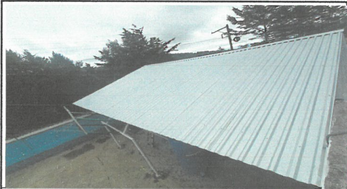
Vista del techo remozado