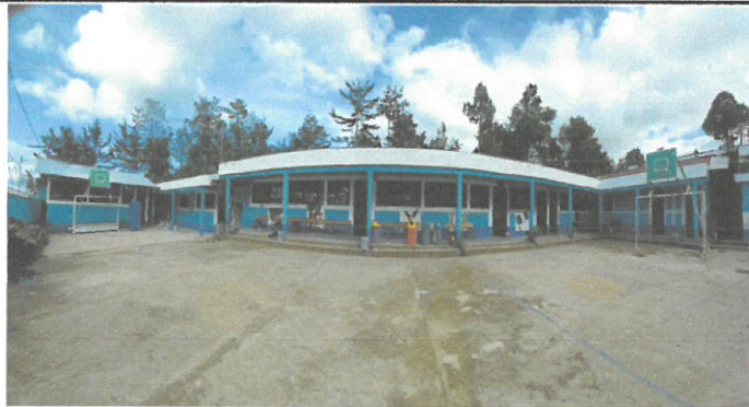
Vista general de la pintura realizada