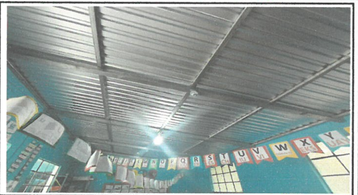
Vista de la estructura sustituida