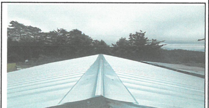
Vista del techo ya cambiado

Observación: Si es necesario se pueden agregar hojas adicionales y adjuntar el número de hojas.