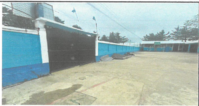
Vista del porton reparado y pintado