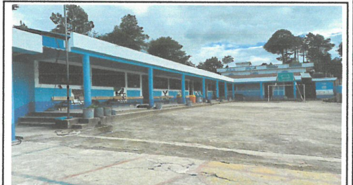
Vista general de la pintura