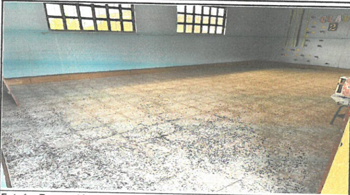
Foto1: Reparación de piso rustico a piso de granito. Finalizado.