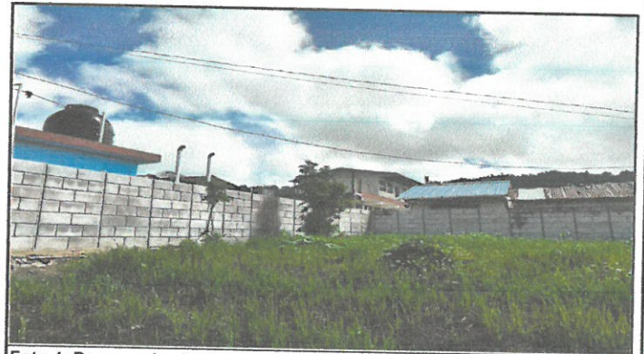
Foto 4: Proceso de circulación perimetral. Finalizado. Finalizado.