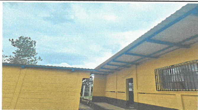
Vista de techo de aulas remozadas