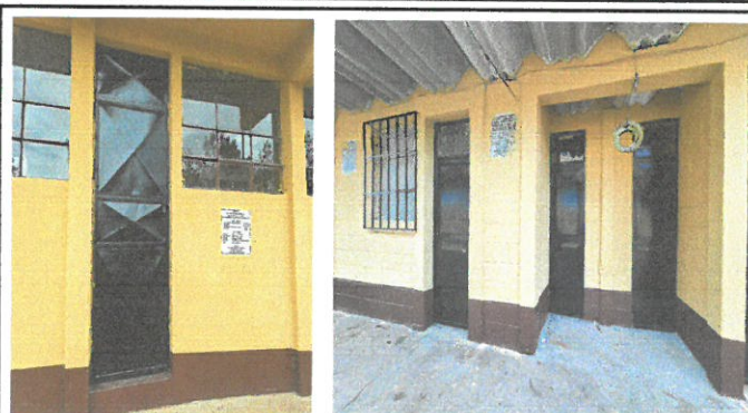
Vista de puertas remozadas