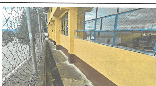
Vista de muros - paredes remozadas

Observación: Si es necesario se pueden agregar hojas adicionales y actualizar el número de hojas.