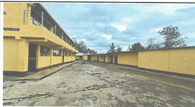
Vista de paredes remozadas.