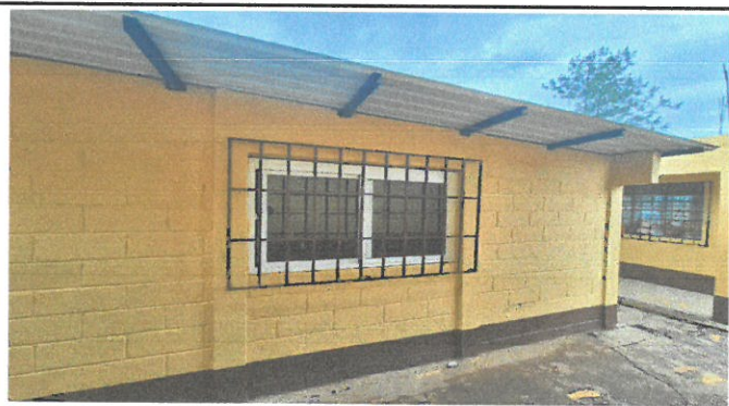
Vista de area de ventanas remozadas