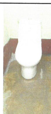
Vista de baños sanitaios remozadas