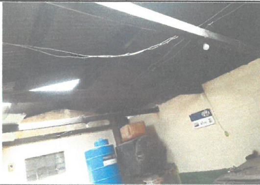
Foto1: Interior de Cocina antes de remozar