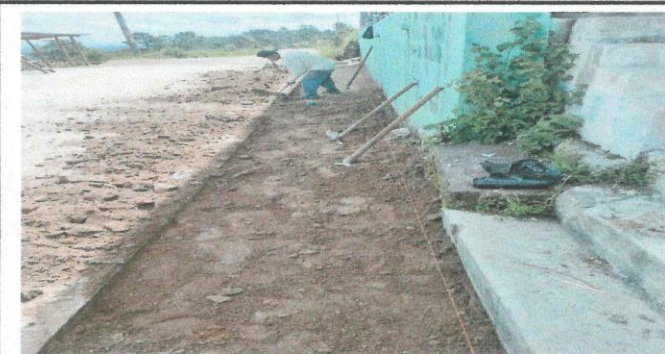
Foto 5: Colocacion de adoquín y fundición frente a las aulas y cocina.