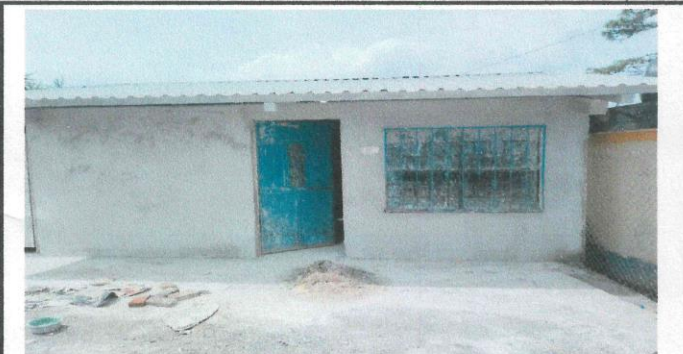
Foto 6: Repellando y posterior sernido de la parte frontal de la cocina.

Observación: Si es necesario se pueden agregar hojas adicionales y actualizar el número de hojas.