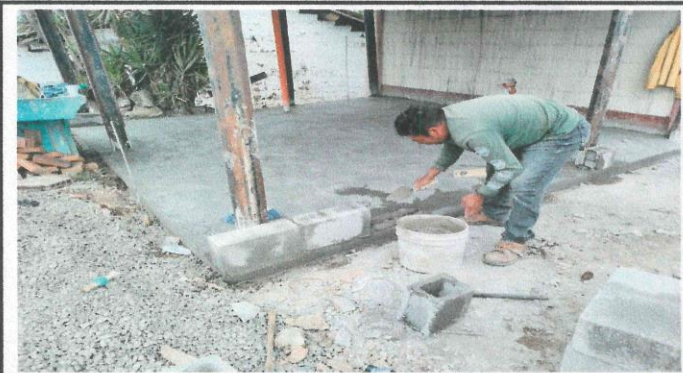
Foto 4: Construcción de la galera para proteger las pilas y lavamanos.