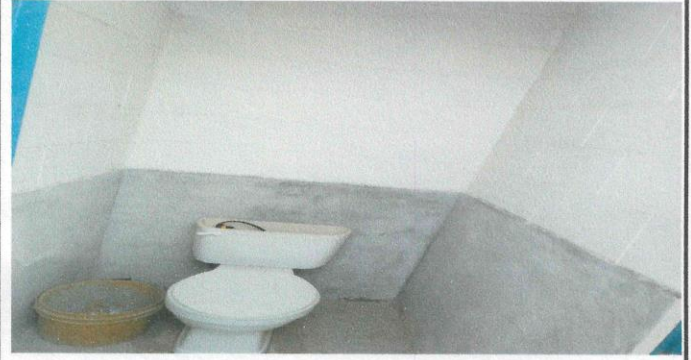
Foto 2: Servicios sanitarios que serán repellados, sernidos, colocación de piso y azulejo.