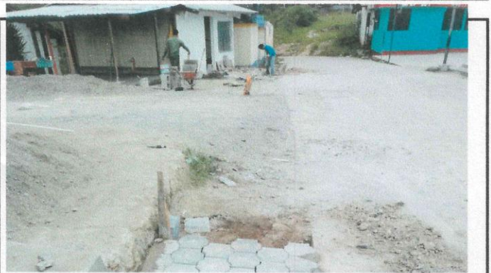
Foto 6: repello, Elavoración de la galera para el area de pilas y lava manos.

Observación: Si es necesario se pueden agregar hojas adicionales y actualizar el número de hojas.