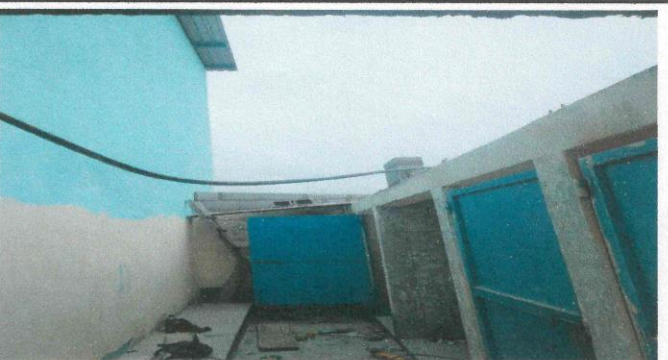
Foto 5: repello, sernido, colocación de piso y azulejo al area de la pila