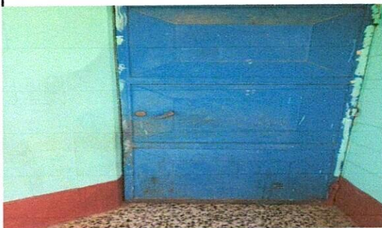
FOTO 3 CAMBIO DE CHAPA Y REPARACION DE 2 PUERTAS