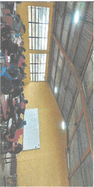
Foto 4. Instalaciones eléctricas en todos los módulos/aulas de la escuela.