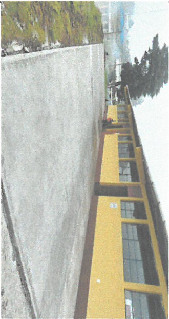
Foto 1. Reparación de plancha de concreto, en patio del establecimiento, módulo 2.