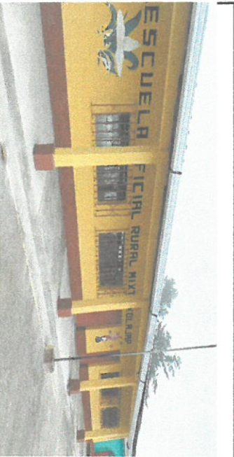
Foto 5. Reparación de plancha de concreto, en corredor del establecimiento, módulo 1.