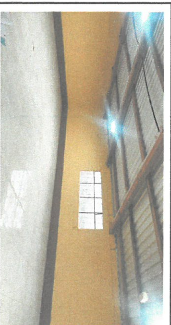
Foto 6. Sustitución de piso torta de cemento en aulas de 6mx6m

Observación: Si es necesario se pueden agregar hojas adicionales y actualizar el número de hojas.