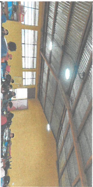
Foto 2. Pintada de paredes exterior de toda la escuela.