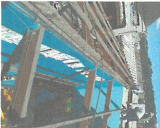
Foto1: Cambio de láminas en seis aulas.