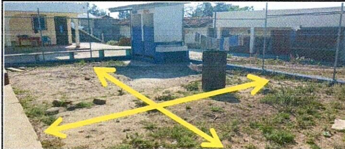
Área de pavimentación