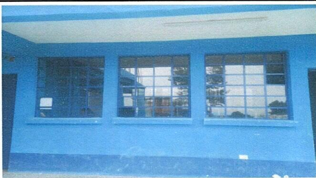
Instalación de balcones en ventanas.