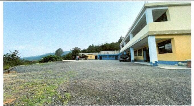
Pavimentación de patio con concreto.