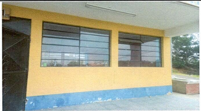
Instalación de balcones en ventanas.