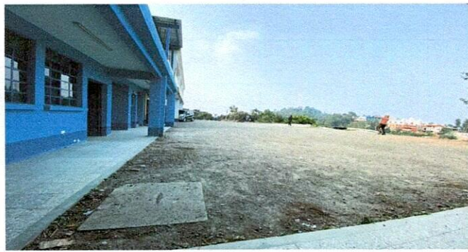
Pavimentación de patio con concreto