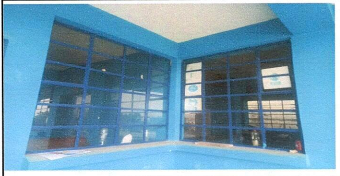
Instalación de balcones en ventanas.

Observación: Si es necesario se pueden agregar hojas adicionales y agregar el número de hojas.