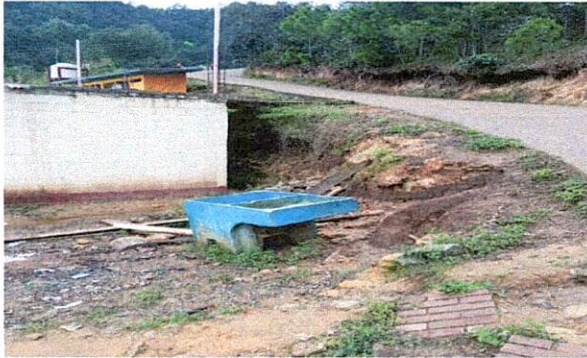
Foto 1: vista donde se realiza la circulación pegado al pavimento