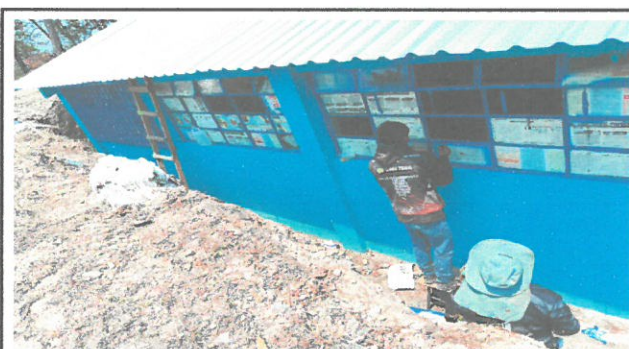
fotografía durante los trabajos de sustitución de vidrios rotos