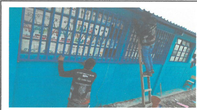
fotografía durante los trabajos de instalación de balcones