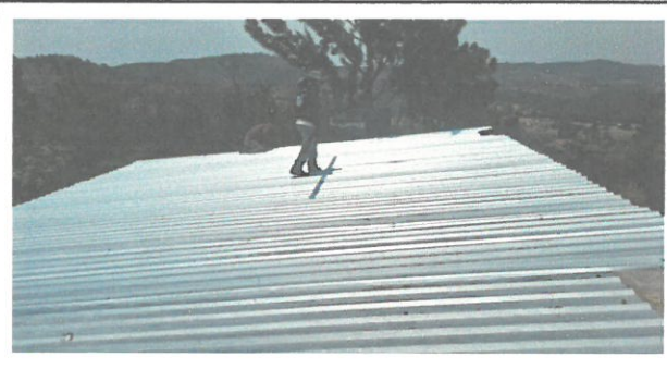
fotografía durante los trabajos de mantenimiento de sustitución de láminas