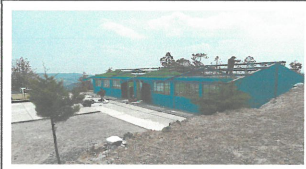
fotografía durante los trabajos de mantenimiento de sustitución de láminas