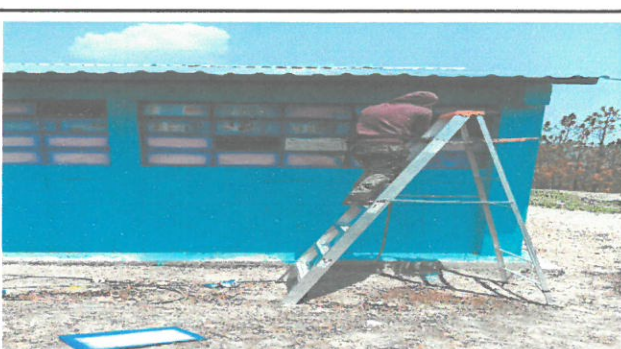
fotografía durante los trabajos de sustitución de vidrios rotos

Observación: Si es necesario se pueden agregar hojas adicionales y actualizar el número de hojas.