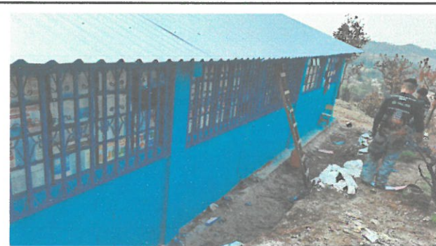
fotografía durante los trabajos de instalación de balcones