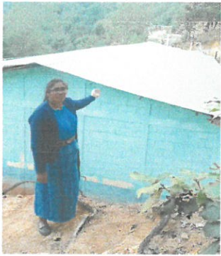
Foto1: Lámina en mal estado