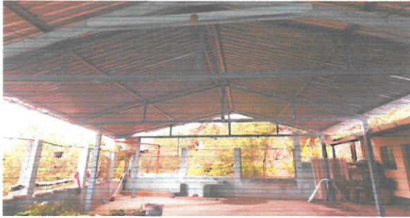
Foto1: Vista frontal del techo.