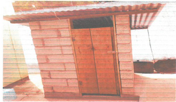
Foto 2: Vista frontal de la remodelación de la caseta del pozo ciego.