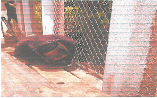
Foto1: Vista de la reparación de mallas del cerco perimetral.