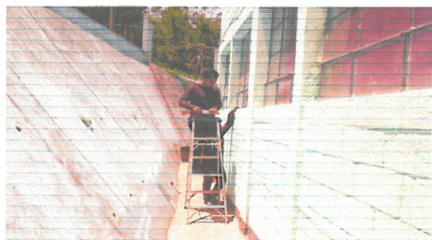
Foto1: Vista sustitución de los vidrios de ventanas