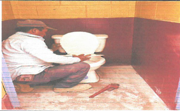
Foto1: Vista frontal colocación de la taza