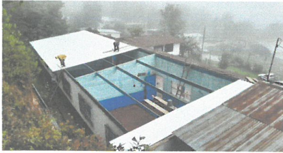
cambio de techo