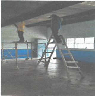
mejoras del instalado eléctrico