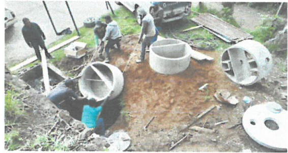
mejoras de servicio sanitario y fosa séptica