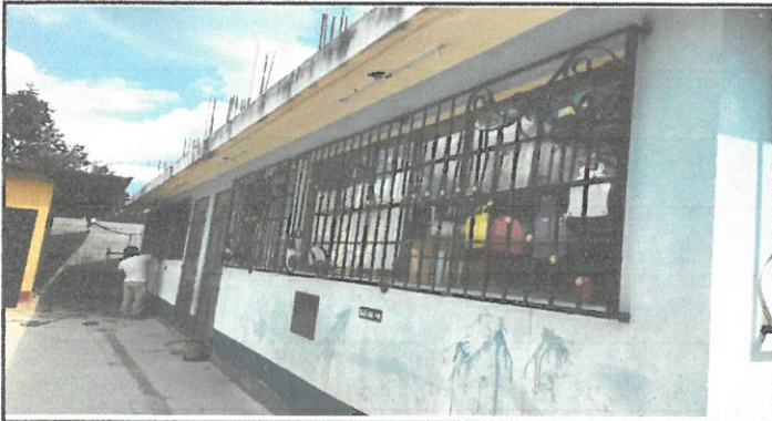
Foto1: Balcones que se están instalando.