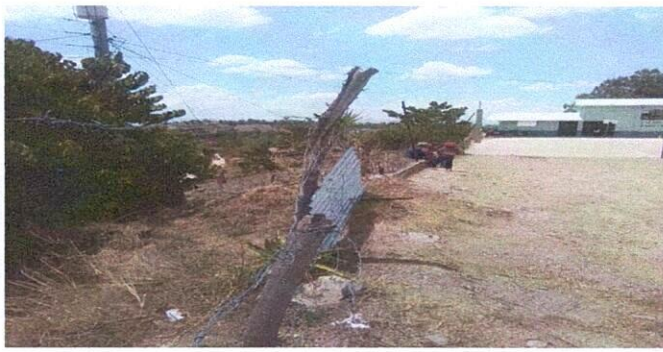
Foto 1: Reparación de cerco perimetral en mal estado lo que ocasiona accidentes con los alumnos.