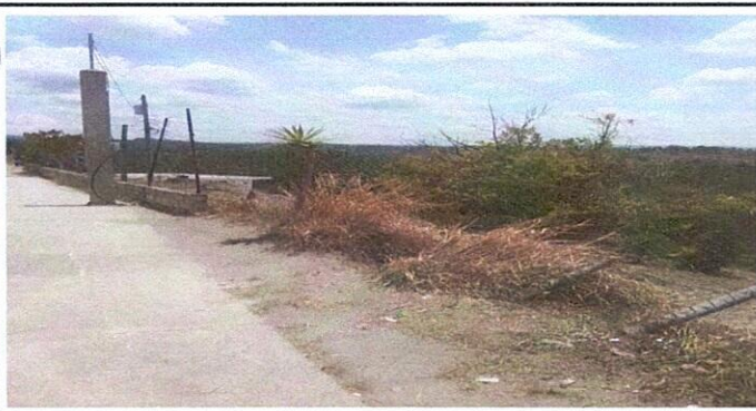
Foto 5: Maya de muro en mal estado por lo que los alumnos sufren lesiones.