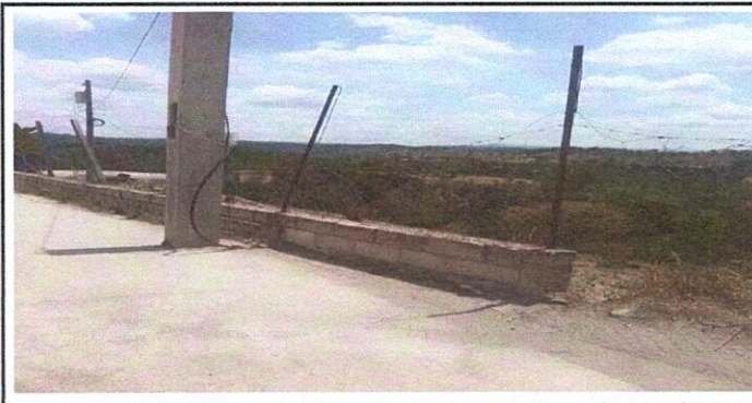
Foto 6: Cerco perimetral en mal estado lo que ocasiona dificultades con los vecinos colindantes.

Observación: Si es necesario se pueden agregar hojas adicionales y actualizar el número de hojas.