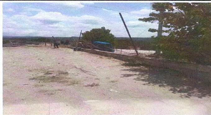
Foto 3: Maya en mal estado lo que ocasiona problemas con los vecinos colindantes.